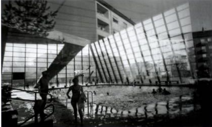
Lucien Hérve, Fotografie, 1964, Palais de congrès, Kunst Sammlung Biel-Bienne

-Ab 19:30 im Restaurant Perroquet vert, Biel-Bienne